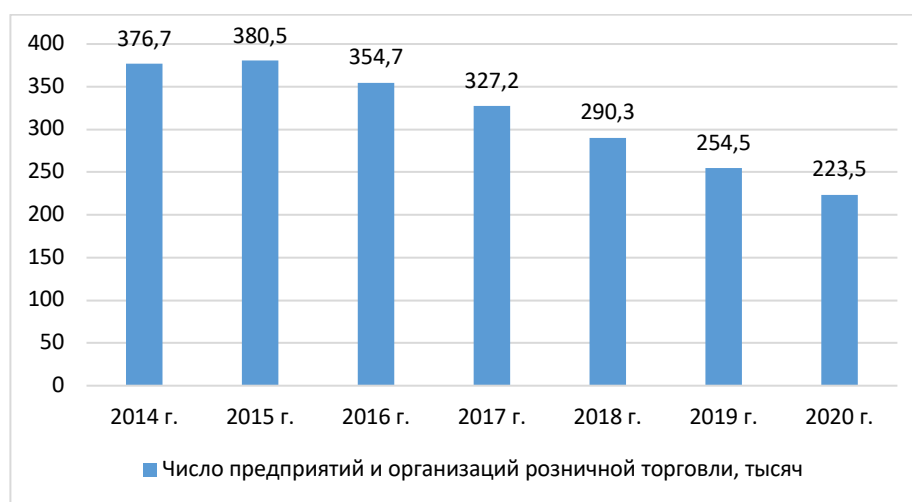
Рисунок 1 – Динамика числа предприятий и организаций розничной торговли, в тыс.[4]

С одной стороны, в современных условиях экономического развития рынок розничной торговли характеризуется высоким уровнем конкуренции, обусловленной достаточно свободным входом в отрасль. С другой стороны, компании розничной торговли в последние несколько лет функционируют в турбулентных условиях, что обусловлено современным уровнем технологий, цифровизацией, активным функционированием онлайн сообществ, что предопределяет высокую вероятность потери части клиентов и, как следствие финансовых результатов. По данным статистического сборника «Торговля в России» в период с 2014 по 2020 гг. число предприятий и организаций розничной торговли сократилось на 41 % (с 376,7 тыс. до 223,5 тыс.) [4, с.34]. Наглядно динамика числа предприятий розничной торговли представлена на рисунке 1.