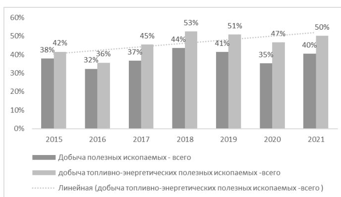
Рисунок 2 – Налоговая нагрузка топливно-энергетического комплекса 2015 - 2021 гг., % [9]

Федеральным законом о внесении изменений в бюджет РФ от 21.11.2022 (№448-ФЗ) предусмотрено увеличение налоговой нагрузки на нефтегазовый сектор экономики в 2023-2025 годах. По нашему мнению, в условиях нестабильной экономики, волатильности цен на нефть, отказа ряда стран от сотрудничества с РФ и как следствие снижения добычи углеводородов, рост налоговой нагрузки на нефтегазовую отрасль отразится на устойчивом развитии компаний.