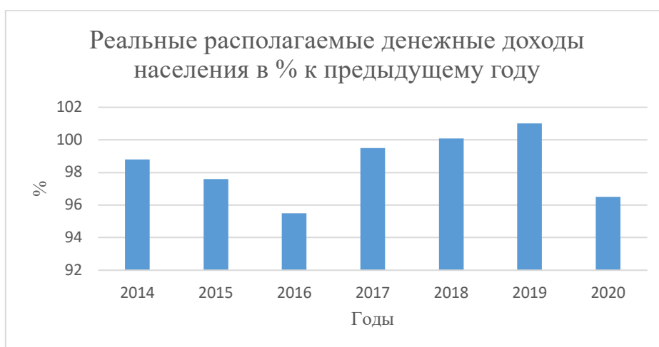
Рисунок 2. Реально располагаемые денежные доходы граждан РФ 2

Когда данные негативные эффекты накопятся, они приведут к падению занятости и снижению выпуска продукции, вследствие всего этого уменьшаются и реальные располагаемые доходы граждан, что заметно на рисунке 2.