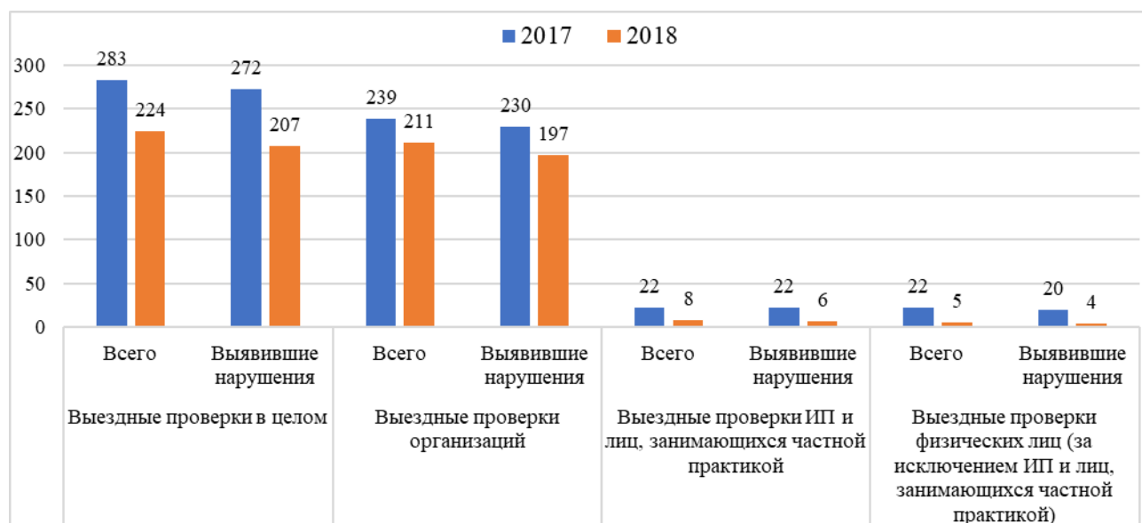
Рисунок 3. Динамика количества выездных налоговых проверок в разрезе проверяемых субъектов, 2017-2018 гг. 5

В результате каждый хозяйствующий субъект имеет возможность управлять своей деятельностью таким образом, чтобы снизить риски попадания в список проверяемых лиц, к чему и стремятся побудить налоговые органы. За 2017-2018 гг. в Санкт-Петербурге число камеральных проверок увеличилось с 3,2 млн до 4 млн, количество выездных сократилось с 283 до 224. Для анализа эффективности выездных налоговых проверок рассмотрим статистику, приведенную на рис. 3.