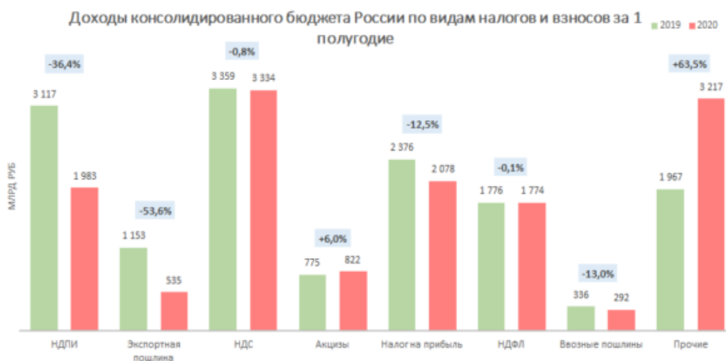
Рисунок 2. Доходы консолидированного бюджета России по видам налогов и взносов за 1 полугодие 2020

Оценивая сегодняшнюю обстановку, необходимо проанализировать налоговые поступления в бюджет (см рис. 2)