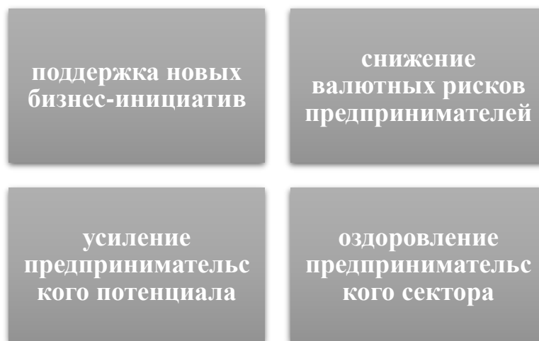
Рис. 2 – Меры по поддержке МСБ

В рамках госпрограммы «Дорожная карта бизнеса – 2020» мерами поддержки по итогам 2017 года было охвачено свыше 192 тысяч предпринимателей и населения с предпринимательской инициативой, что на 10% больше по сравнению с 2016 годом.