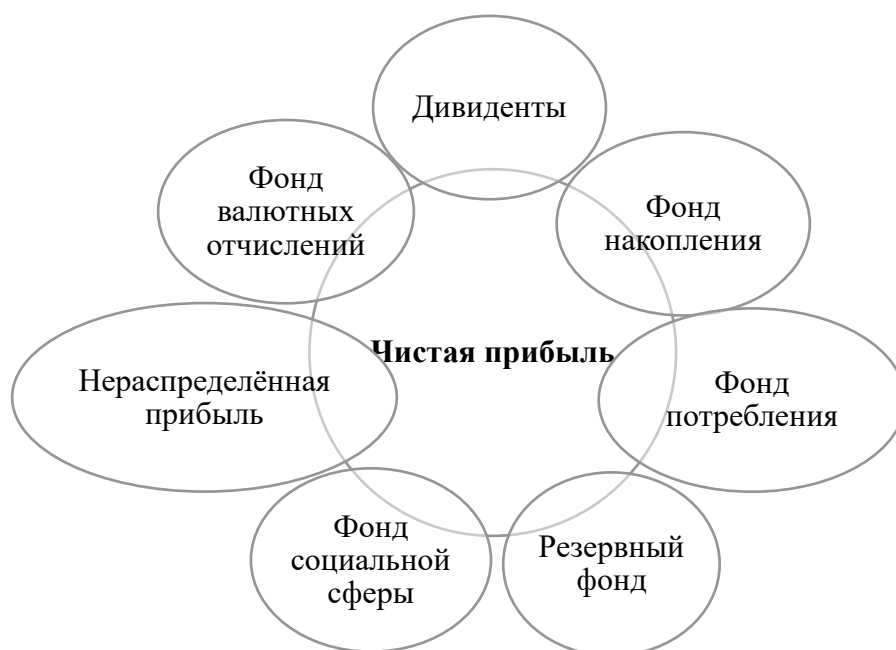
Рисунок 2. Распределение чистой прибыли 2

Чистая прибыль – это сумма в бухгалтерском балансе организации, которая остается после формирования фонда оплаты труда и уплаты налогов, отчислений, обязательных платежей в бюджет, в вышестоящие организации и банки. Чистая прибыль показывает, насколько в действительности выгодно работать в том или ином направлении, стоит ли вести бизнес дальше или приостановить дело.