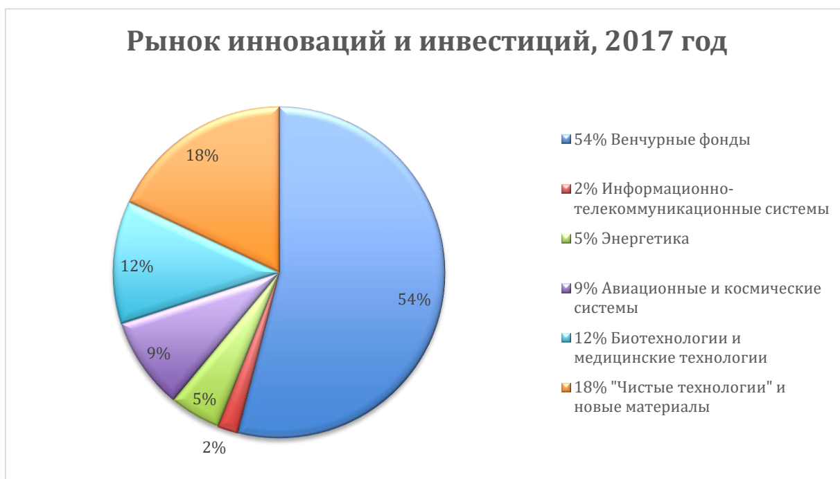
Рис. 1 – Рынок инноваций и инвестиций, 2017 год. Составлено основе данных официального сайта Московской биржи [8].

В настоящее время в сегменте РИИ-Прайм обращаются акции ПАО "ОАК" и пять выпусков облигаций АО "Роснано".