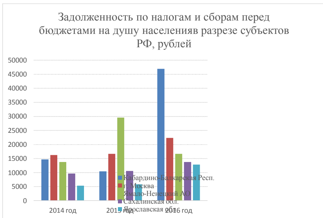
Рис. 1 - Задолженность перед бюджетами по налогам и сборам на душу населения в динамике за последние три года в разрезе субъектов РФ (субъекты с наиболее высоким уровнем задолженности)

На рис. 1, 2 и 3 ниже представлена информация о задолженности по налогам и сборам перед бюджетами в разрезе субъектов Российской Федерации за последние три года.