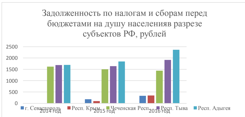
Рис. 2 - Задолженность перед бюджетами по налогам и сборам на душу населения в динамике за последние три года в разрезе субъектов РФ (субъекты с наиболее низким уровнем задолженности)