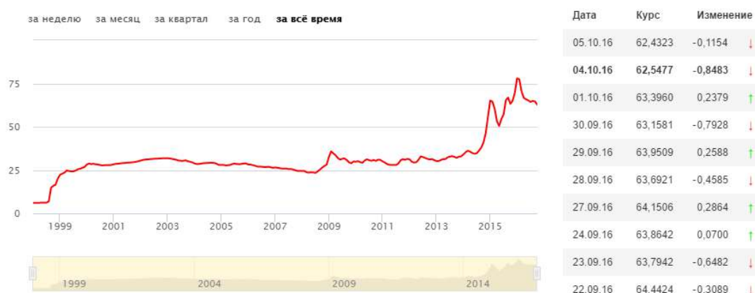
Рисунок 1 Динамика курса доллара США к рублю (USD, ЦБ РФ)

В условиях чрезмерной зависимости российской экономики от импорта, девальвация рубля влечет за собой достаточно высокую инфляцию в России. В таблице 2 представлена инфляция в России за 2000-2016 гг. С 2014 года наблюдается инфляция в размере 11,36%, именно в этот период началась девальвация рубля [9].