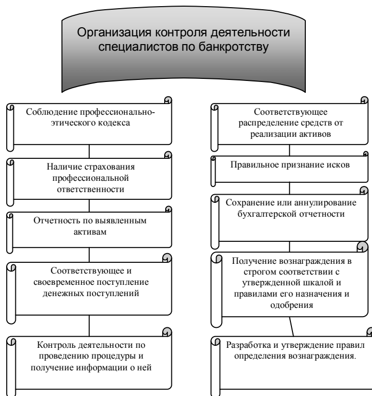
Рис. 2 Функции и полномочия государственных органов по банкротству зарубежных стран по контролю (надзору) за деятельностью праттиков по банкротству[1;с.147].

Например, Австралийский орган финансовой безопасности (Australian Financial Security Authority (AFSA)) (панее Служба несостоятельности и трасти Австралии (Insolvency and Trustee Service Australia (ITSA))[2] 2 является правительственной организацией. Цель AFSA обеспечивать улучшенные и справедливые финансовые результаты для потребителей, бизнеса и общества путем применения законов о банкротстве и о ценных бумагах, регулирование деятельность практиков по вопросам несостоятельности и опекунские услуги. AFSA также отвечает за управление и регулирование системы несостоятельности и персональной неплатежеспособности в Австралии, осуществляет регистрацию и контроль